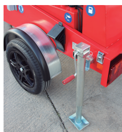
Supports de hauteur réglables