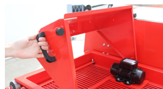
Écran de trémie